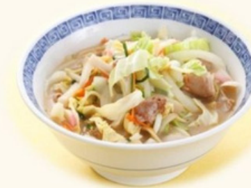
ちゃんぽん 900円 CHANPON NOODLES