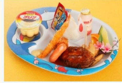
おこさまランチ KID'S PLATE 820 円