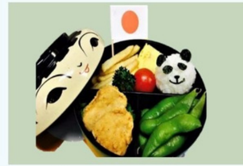
パンダちゃん PANDA CHAN 440 円