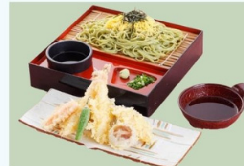
天ぷら茶そば 1,300円 TEMPURA & SOBA NOODLES