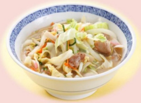
ちゃんぽん 900円 CHANPON NOODLES