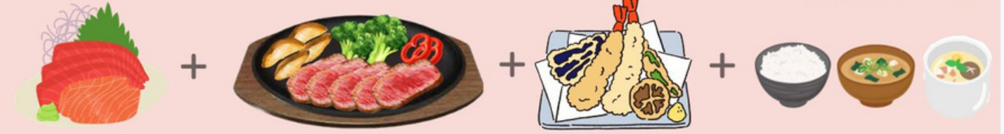
しきぶ 3,000円 SHIKIBU (刺身2点盛、牛ステーキ、天ぷら、ご飯、みそ汁、茶碗蒸し)