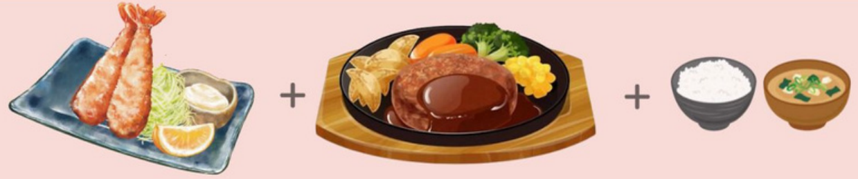
エビフライバーグ定食 1,400円 PANKO PRAWN & HAMBURGER