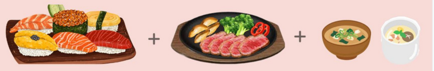
花つづみ 2,400円 HANATSUZUMI (6貫にぎり、牛ステーキ、みそ汁、茶碗蒸し)