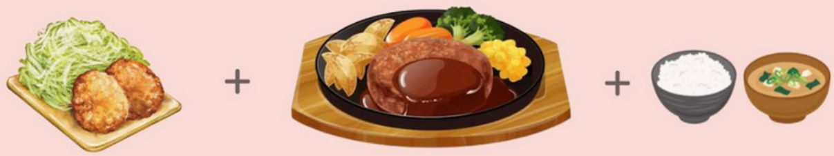
クリームコロケバーグ定食 1,390円 CREAM CROQUET & HAMBURGER