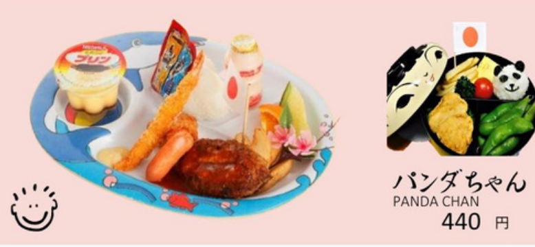
おこさまランチ 820円 KID'S PLATE *お子様は10歳まで