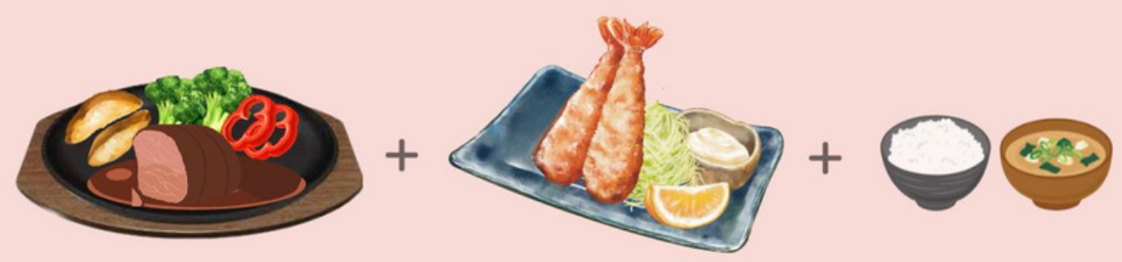
ビーフシチュー & エビフライ 1,590円 BEEF STEW & PANKO PRAWN