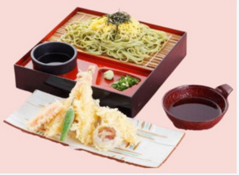
茶そば & 天ぷら 1,300円 TEMPURA & GREEN TEA SOBA