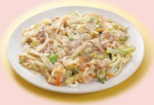
血うどん 900円 SARA UDON NOODLES